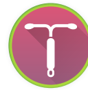
DIU com cobre Até 10 anos