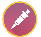
Injeção A cada 3 meses