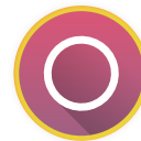
Anel Vaginal Uma vez por mês