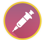
Injeção A cada 3 meses